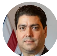
樂保羅 共和黨 保守黨