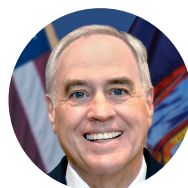
湯瑪斯·狄拿玻里 民主黨 勞動家庭黨