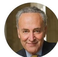
查爾斯·舒默 民主黨 勞動家庭黨