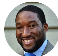
喬·品尼恩 共和黨 保守黨