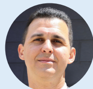
麥克·亨利 共和黨 保守黨